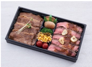
米沢牛特盛ピリ辛焼肉・ステーキ弁当 味の梅ばち (大丸東京店 B1) / 3,780円

八重洲エリアには、贅沢なお肉たっぷりのお弁当や見た目も鮮やかな週替わりのカレーなど、暑い夏にぴったりのグルメがたくさんあります。ごっつあんチャレンジとあわせて、バリエーション豊富なスタミナグルメもぜひお楽しみください。 ※記載の価格は全て税込です。