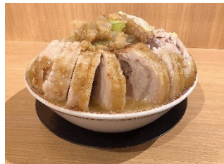
大ぶたダブル (全マシ) 豚山 (ヤエチカ B1) / 1,350円

焼肉×ステーキの肉づくし弁当。すべて米沢牛を使用し、焼肉は豆板醤でピリッと辛く、ステーキはニンニク味に仕上げ、特盛りにした「お肉たっぷり」で食欲マシマシのお弁当です。