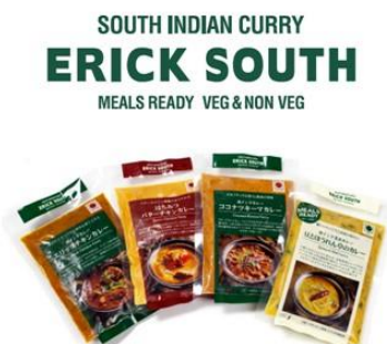
エリックサウス 「トライアルパック(スタンダード)」

ヤエチカの人気店お取り寄せグルメ(3,000 円相当) 合計 50 名様(各 25 名様) ※賞品は選べません