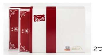
銀座スイス 「洋食屋のカレーソース(2食セット)」2つ