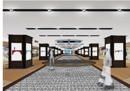
メイン・アベニュー イメージ (2022年8月完成)