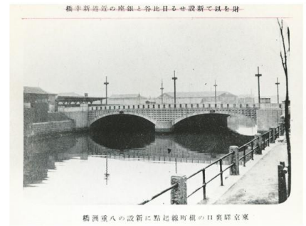
八重洲橋

時代は移り変われど「つながり」を大切にしたい、姿勢、おもてなしを忘れずに、未来まで脈々と受け継がれていく象徴を意味します。