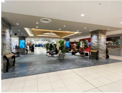
センタースポット(2022年6月完成)

地上の再開発ビル群との差別化を図るため先進性と懐かしさを融合し、地下でも季節感や時間変化などを五感で感じることが出来る空間を創造、また日々の中で新しい情報を発信し、都市での癒しの場所として、従来の地下街のイメージを一新します。