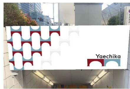
館内サイン変更後イメージ