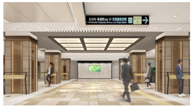
サウススポット イメージ (2022年度完成予定)