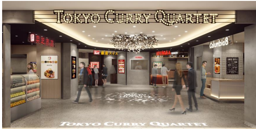
TOKYO CURRY QUARTET 入口イメージ

東京駅周辺で働くオフィスワーカーをはじめ、国内外から多くの人々が訪れるヤエチカに、日本人のなじみ深いカレーの人気店が集結した新たな編集ゾーン「TOKYO CURRY QUARTET」(トウキョウ カレー カルテット)が2022年2月オープン予定。人気4店舗の様々なジャンルのカレーが楽しめます。