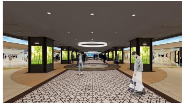
メインアベニュー イメージ (2022年度完成予定)