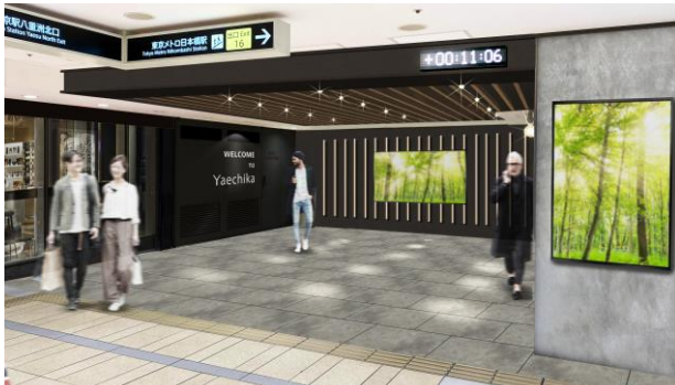
ノーススポット イメージ (2022年度完成予定)