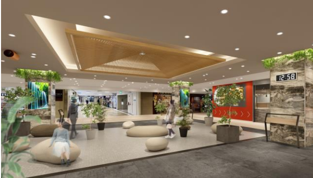
センタースポット イメージ (2022年2月完成予定)

地上の再開発ビル群との差別化を図るため先進性と懐かしさを融合し、地下でも季節感や時間変化などを五感で感じることができる空間を創造、また日々の中で新しい情報を発信し、都市での癒しの場所として、従来の地下街のイメージを一新します。