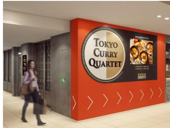
TOKYO CURRY QUARTET 外観イメージ